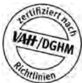
VAH-Prüfsiegel zu Desinfektionsmitteln

Zur Händedesinfektion sollen nur Produkte verwendet werden, deren Wirksamkeit belegt ist, Geprüfte und als wirksam deklarierte Mittel werden z. B. in der Desinfektionsmittel-Liste des VAH (Verbund für angewandte Hygiene e.V.) 1 geführt. Informationen über die VAH-Listung finden sich in der Regel auf dem Produkt selbst bzw. auf dem Produktdatenblatt (siehe Abbildung VAH-Prüfsiegel). Auch bei den Herstellern der Desinfektionsmittel oder den Hygiene-Beratern der Kassenärztlichen Vereinigungen können Informationen über die Listung der Mittel eingeholt werden. Die Verwendung VAH-gelisteter Mittel ist indes nicht rechtlich vorgeschrieben.