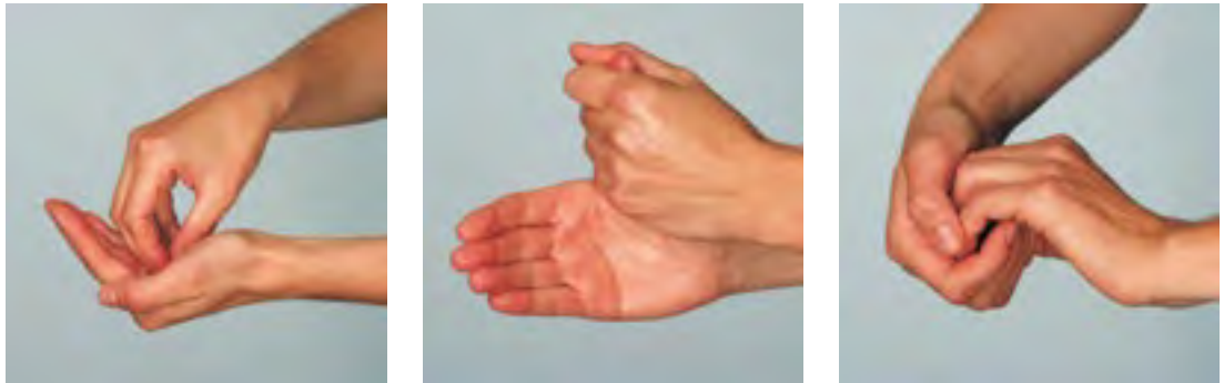
Einreibemethode zur Händedesinfektion in drei Schritten

Besondere Aufmerksamkeit gilt dem Einreiben von Fingerkuppen, Nagelfalz und Daumen.