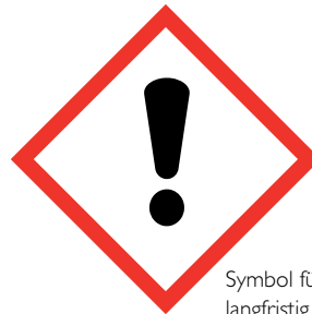
Symbol für reizende, langfristig toxische Stoffe

Um einen sicheren Umgang mit Gefahrstoffen zu gewährleisten, müssen Praxisinhaber gemäß Gefahrstoffverordnung (GefStoffV) die Gefahrstoffe in der Praxis ermitteln und einer Gefährdungsbeurteilung unterziehen.